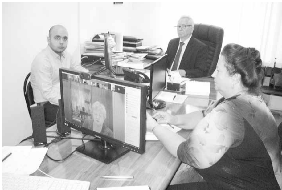
Заседание президиума прошло в режиме онлайн