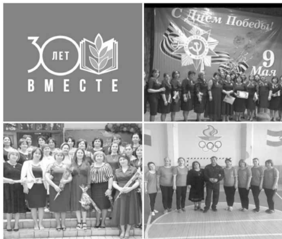
Школа села Арик, Терский район Кабардино-Балкарской Республики