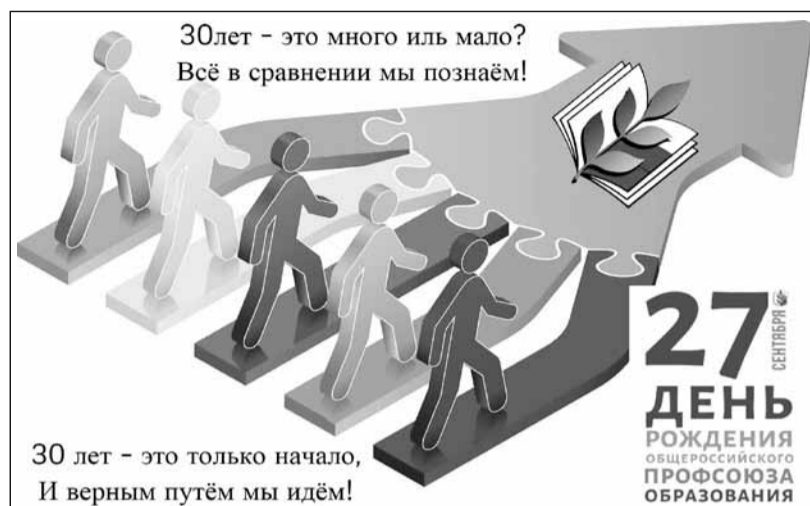
Профсоюзная организация детского сада № 172 Тюмени

На этой газетной странице - креативные открытки, фотографии полюбившейся акции «Нас объединяет книга» и даже тортики (какой день рождения без сластей?!) - малая часть подарков к юбилею. С праздником, друзья! И спасибо за поздравления!