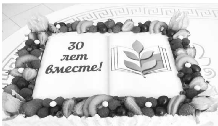
Новоспасская районная организация профсоюза, Ульяновская область