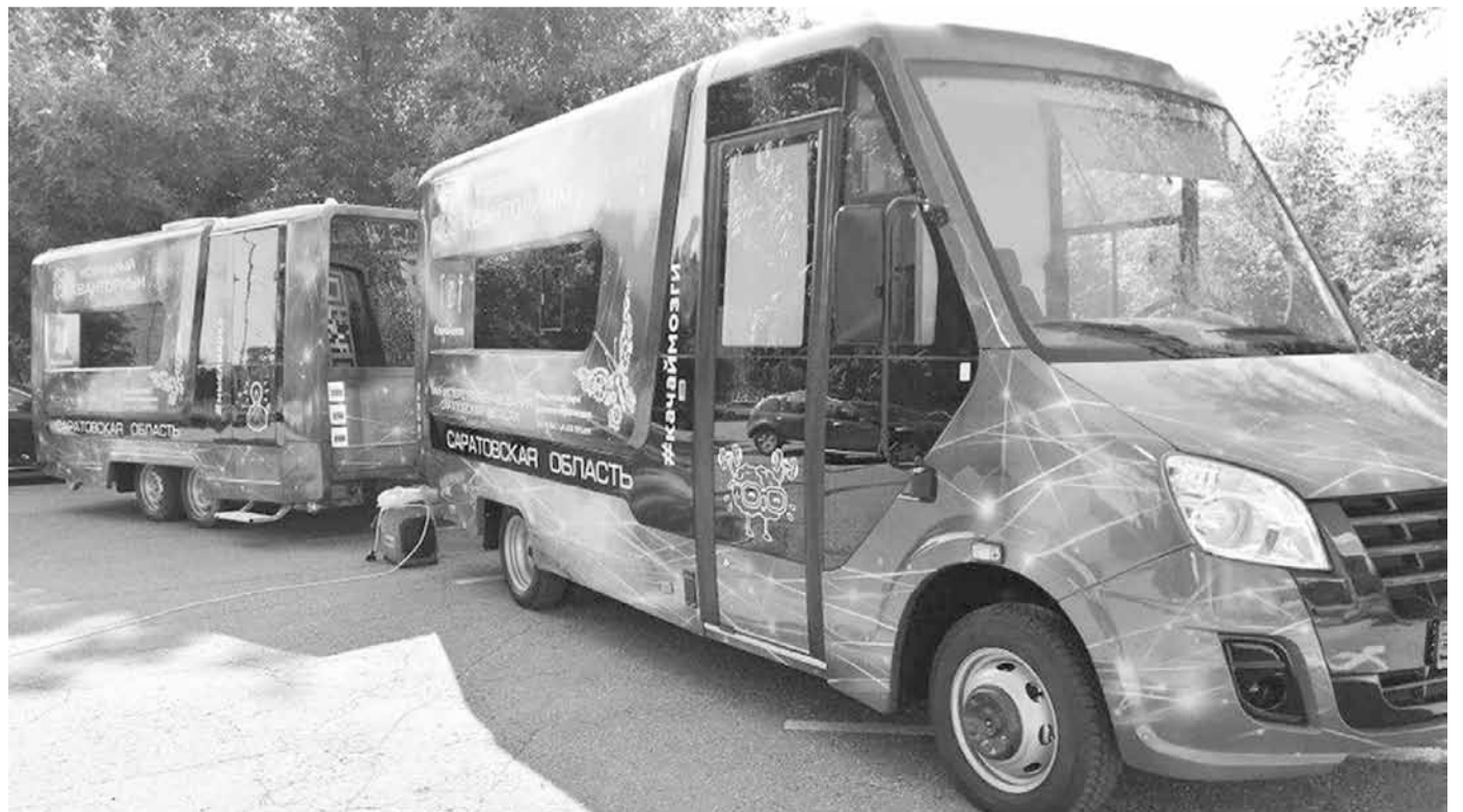
Мобильный технопарк «Кванториум»

Саратовцам не удалось перейти на окладную систему оплаты труда, поскольку денег в регионе на это не хватает, особенно сложно малокомплектным школам. Проф-