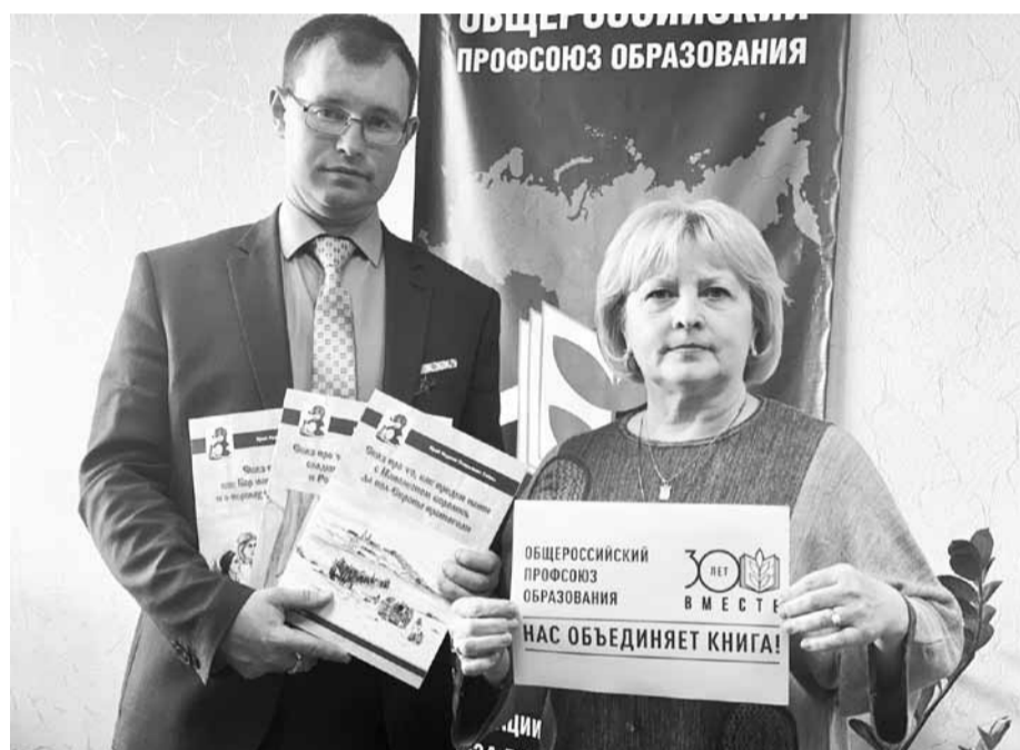
Борская районная организация профсоюза, Нижегородская область