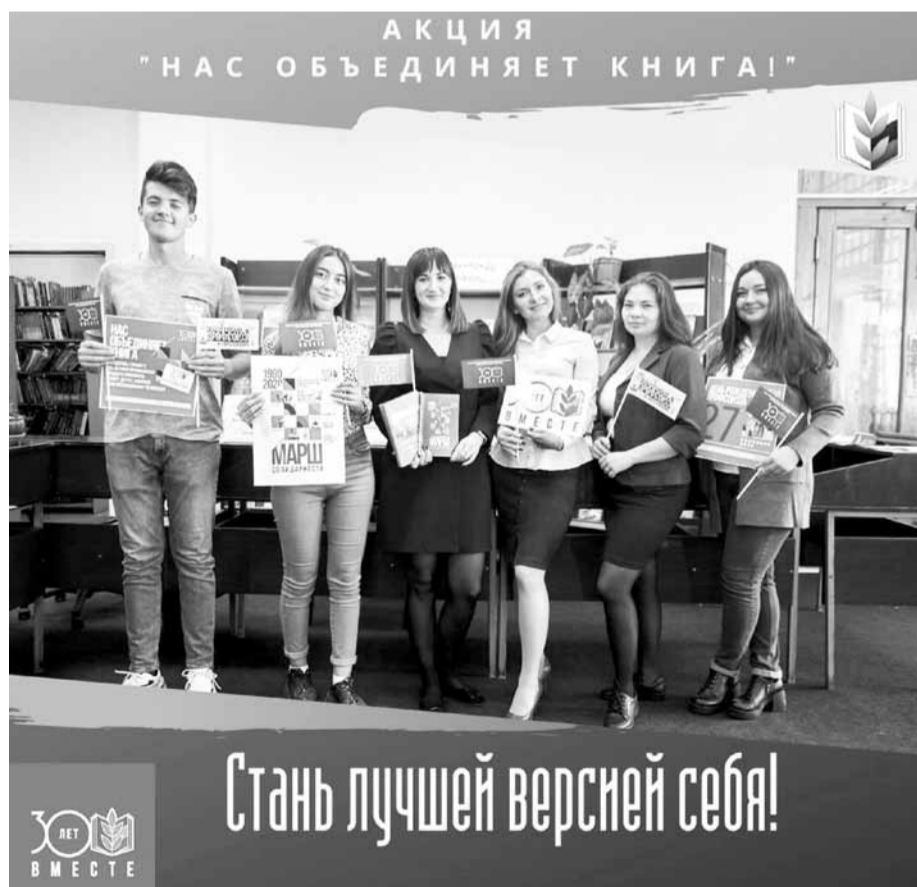
Ульяновский государственный технический университет